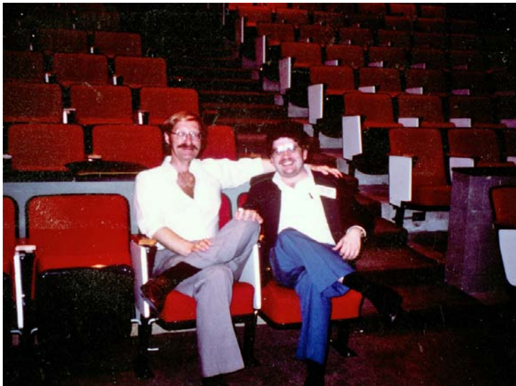
Figure 9: One of the PA conferences we attended together early on, 1983–1985. Most likely this one was from the PA at Tufts University, Boston, 1985.